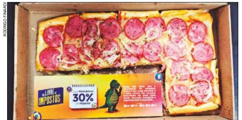
A pizza da CDL Erechim cumpriu um papel raro, transformando números frios em indignação palpável

E a crítica não é contra o imposto em si. Nenhuma sociedade funciona sem arrecadação. O ponto central é outro: paga-