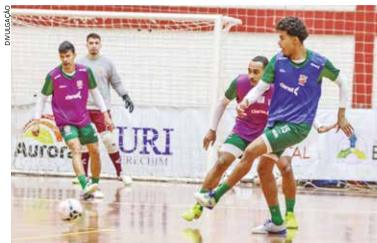
Galo seguirá com a programação de treinos visando manter os bons resultados que tem alcançado

Na Liga Nacional, o Atlântico assumiu a vice-liderança no sábado, após vencer o Corinthians. Na Série Ouro estreou com vitória contra o Riograndense fora de casa.