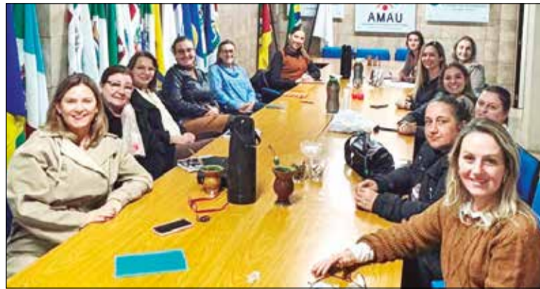
Vários temas foram debatidos na reunião do colegiado das primeiras-damas da AMAU, entre eles a confirmação da realização da 2ª Mostra de Talentos do Alto Uruguai

Outro tema tratado durante a reunião foi a realização de encontros municipais para dialogar sobre feminicídio e violên-