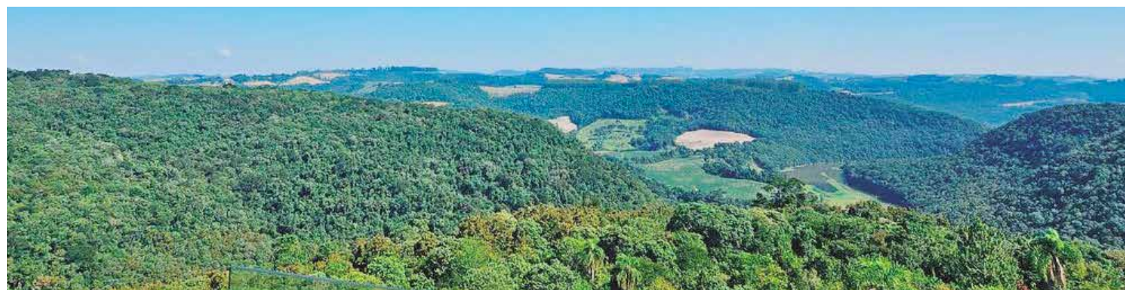
O Parque Natural Municipal Mata do Rio Uruguai Teixeira Soares em Marcelino Ramos tem 423 hectares de mata nativa