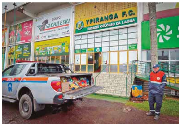
Doações foram entregues para a Força Voluntária e Defesa Civil

O Ypiranga segue recebendo doações e convida todos a participar. Quem desejar colaborar pode entregar roupas em