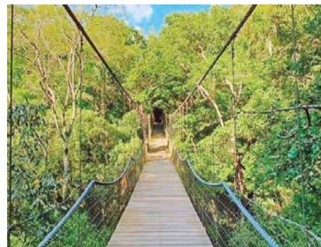
O Parque Teixeira Soares oferece aos visitantes, trilhas, mirantes, passarelas, auditório e sala interativa. Tudo isso em meio à mata e em total sintonia com a natureza

No Alto Uruguai, onde nascentes, rios e pequenas propriedades rurais dependem diretamente do equilíbrio ambiental, preservar a Mata Atlântica significa proteger a própria sobrevivência regional. Árvores nativas ajudam na manutenção da água, no equilíbrio das