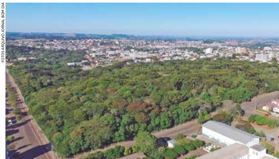
Em Erechim, uma das principais referências de preservação ambiental é o Parque Natural Municipal Longines Malinowski, considerado um verdadeiro refúgio verde em meio à área urbana

Em Erechim, uma das principais referências de preservação ambiental é