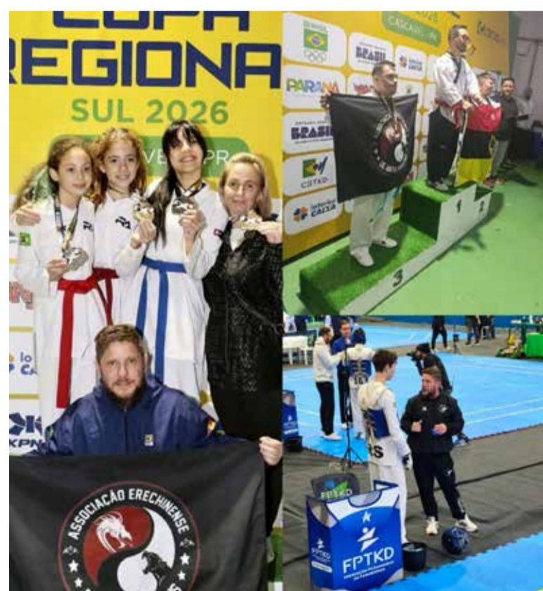
Competição aconteceu no último final de semana