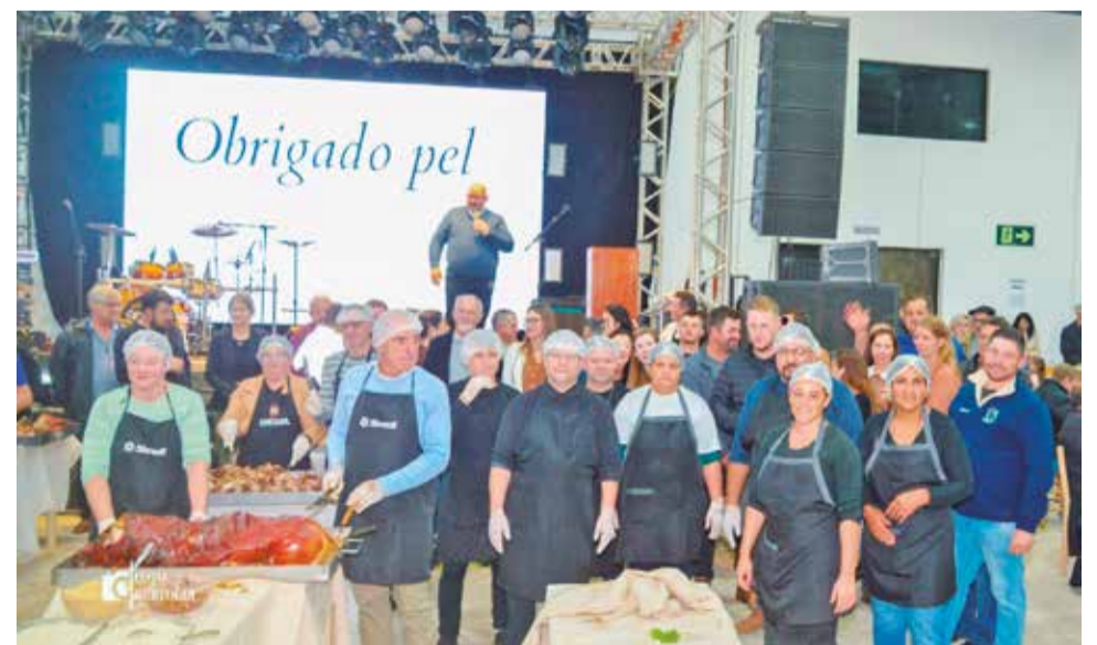
Programação contou com a realização da 21ª edição do tradicional Jantar do Suíno

Durante os discursos, também foi mencionada a pavimentação da ERS-487, ligação entre Benjamin Constant do Sul e a BR-480, obra relacionada à mobilidade regional e ao escoamento da produção agrícola.