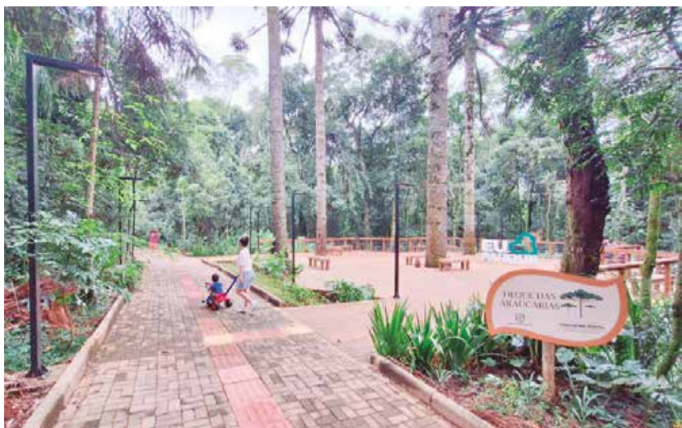
O Parque Longines Malinowski possui cerca de 24 hectares de Mata Atlântica preservada e é classificado como Unidade de Conservação de Proteção Integral