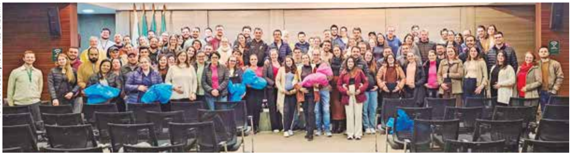
Ao todo foram mais de 71 gestantes e seus acompanhantes em momentos de orientação, troca de experiências e preparação para a chegada do bebê

criança. “A gente entende o quanto o apoio à mãe faz diferença e também sobre o desenvolvimento da criança em especial os três primeiros anos e que acaba impactando no futuro do nosso filho”, destaca.