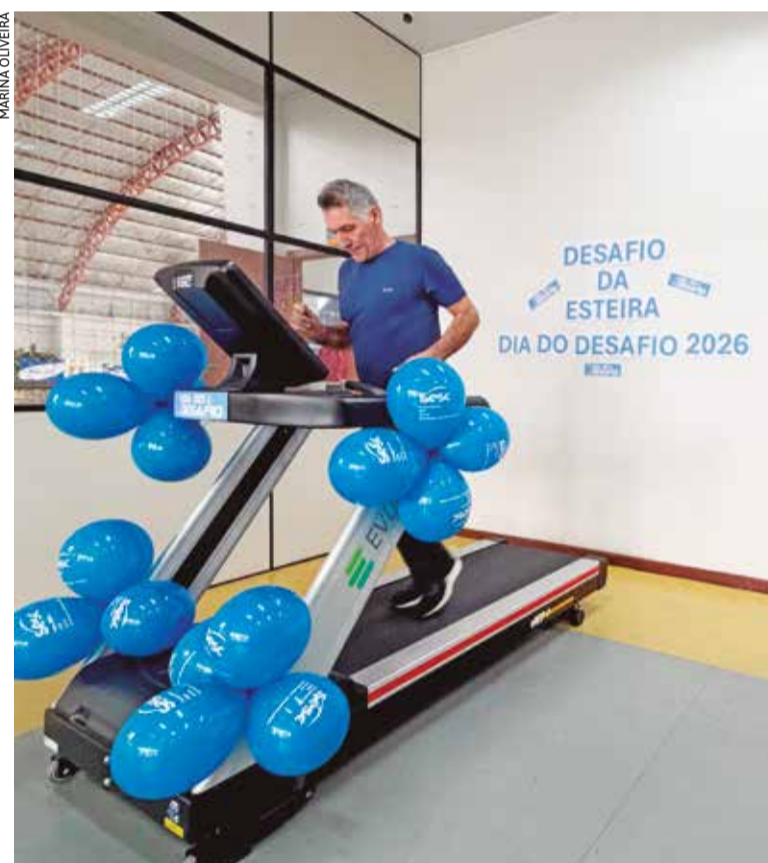
Entre as ações promovidas estiveram o desafio da esteira, o desafio do abdominal, aula de pilates solo, amistoso de voleibol entre turmas da Formação Esportiva do Sesc e caminhada noturna de 10 quilômetros