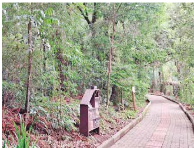
Além da proteção da biodiversidade, o Parque Longines Malinowski contribui diretamente para a qualidade do ar, regulação térmica e preservação de nascentes urbanas

temperaturas e na conservação da biodiversidade que sustenta a agricultura e a vida humana.