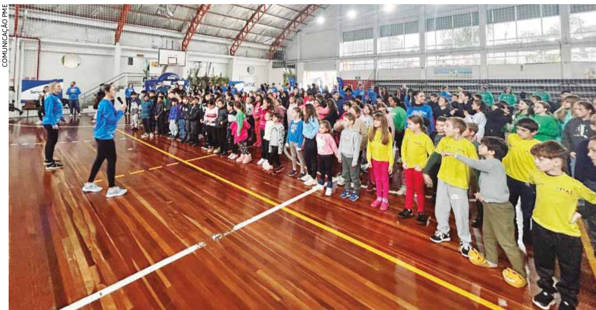
Atividades ocorreram no Sesc Erechim e reuniram participantes de diferentes faixas etárias

o desafio contínuo da esteira, realizado durante todo o dia com a participação dos alunos da academia.