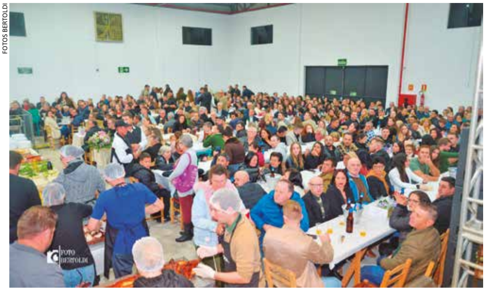
Centro de Eventos São Roque conta com espaço para recepção de público, churrasqueiras, sanitários, cozinha industrial, copa e salas destinadas às atividades da paróquia

O Centro de Eventos São Roque conta com espaço para recepção de