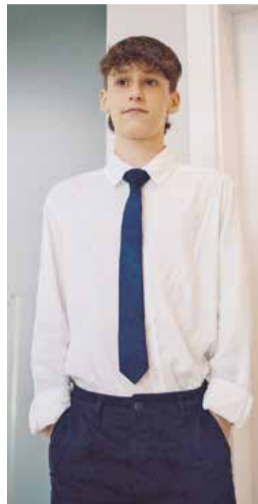
O jovem leva a vida de forma tranquila junto da família e dos amigos

Hoje, mais de 85% das crianças com essas condições chegam à vida adulta. Além disso, muitas cardiopatias podem ser identificadas ainda na gestação. “O diagnóstico precoce aumenta as chances de sucesso do tratamento e reduz a mortalidade”, destaca.