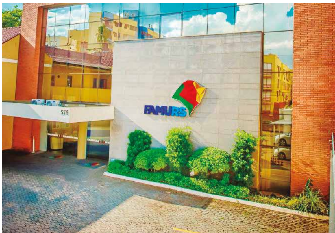
Maior evento do municipalismo gaúcho ocorrerá de 4 a 6 de agosto, em Restinga Sêca, com debates focados em sustentabilidade, inovação e eficiência na gestão pública

As inscrições para o 44º Congresso de Municípios serão abertas em breve. Os gestores e suas equipes de governo já são orientados a reservarem o período na agenda institucional para garantir a representatividade de suas respectivas regiões.