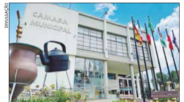
O encontro acontece no dia 22 de junho, às 9h, na Câmara de Vereadores

A obra será realizada por meio da Secretaria Municipal de Obras Públicas, Habitação, Segurança e Proteção Social, com recursos provenientes de transferência de convênio firmado com o Estado, através do DAER/RS.