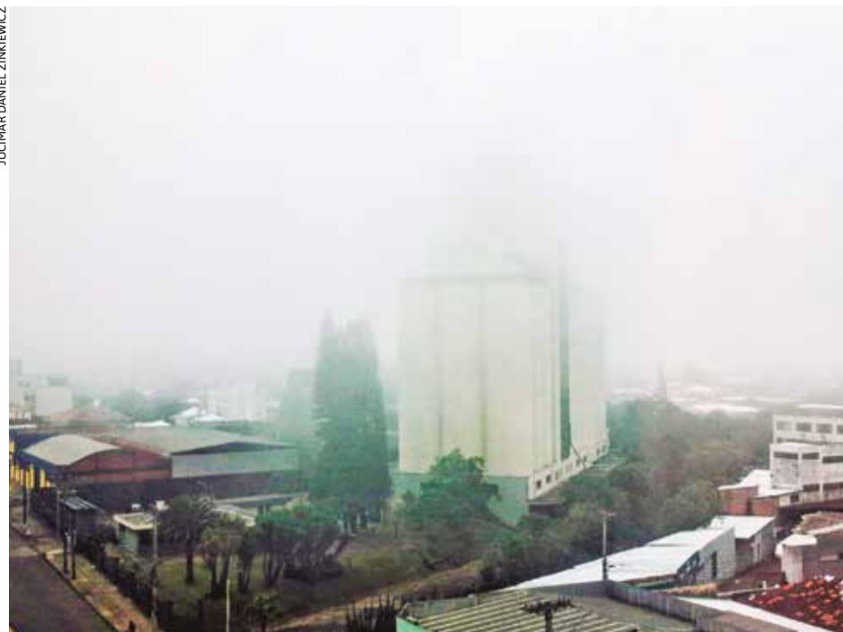
A neblina chegou sem pressa e tomou conta de Erechim, apagando contornos e suavizando o horizonte. Os antigos silos da CESA, quase engolidos pelo branco da manhã, surgem como sentinelas silenciosas entre o céu e a terra. Por instantes, a cidade parece suspensa no tempo, envolta em um véu delicado que transforma concreto em poesia e rotina em contemplação. Na paisagem, o que se esconde também encanta, revelando a beleza serena dos dias em que a neblina decide contar sua própria história.