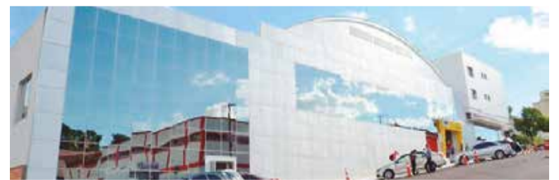
Novo pacote turístico está sendo organizado pelo Sesc/RS

Com saída de Porto Alegre e embarque no Porto de Itajaí, em Santa Catarina, o cruzeiro terá sete noites de navegação e passará por Santos, Buenos Aires e Montevideu. Além das paradas programadas, os viajantes poderão aproveitar toda a infraestrutura oferecida pelo navio, que conta com restaurantes, piscinas, hidromassagens,