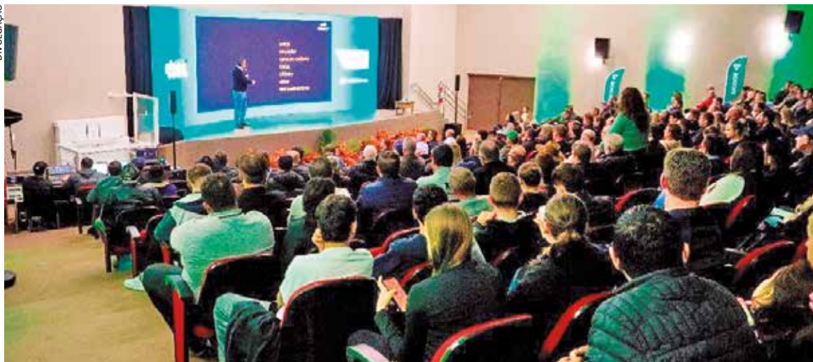
Os encontros reuniram mais de 800 participantes, entre produtores, cooperados, autoridades e parceiros

O Sicoob Crediauc promoveu nos dias 2 e 3 de junho o Workshop de Lançamento do Plano Safra 2026/2027, em Concórdia (SC) e Erechim (RS), respectivamente. Os encontros reuniram mais de 800 participantes, entre produtores, cooperados, autoridades e parceiros, consolidando-se como momentos de grande relevância para o fortalecimento do agronegócio regional.