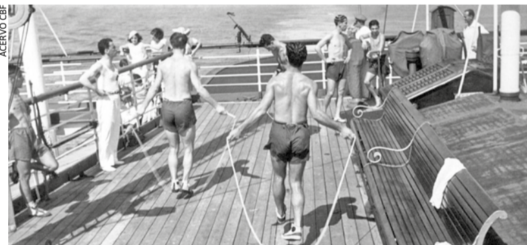
Seleção Brasileira treinando no navio "Conte de Biancamano"

Diferentemente da Copa de 1930, a edição de 1934 foi realizada em formato eliminatório, já a partir das oitavas de final. Por sorteio, o Brasil teria a Espanha pela frente. Em 27 de maio, no Estádio Luigi Ferraris, na cidade de Gênova, a Seleção foi derrotada por 3 a 1. Ao fim da etapa inicial, o placar já estava em 3 a 0. Leônidas da Silva, o