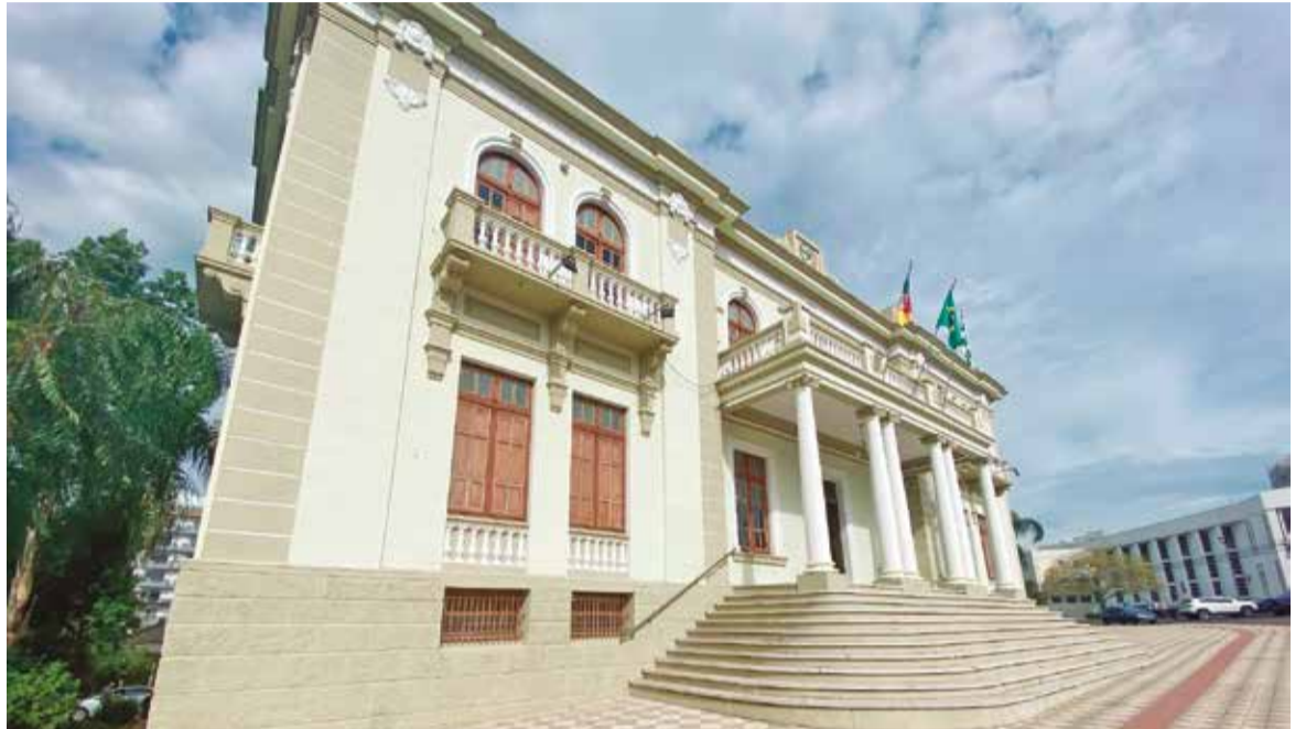
Erechim conta atualmente com cerca de três mil servidores públicos atuando em diferentes áreas