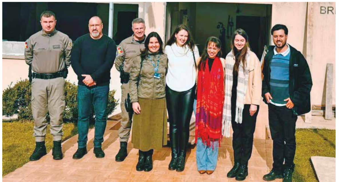
Grupo conheceu de perto a execução de iniciativa originada em trabalho de conclusão de curso

O Tenente-Coronel Detoni destacou a importância da co-