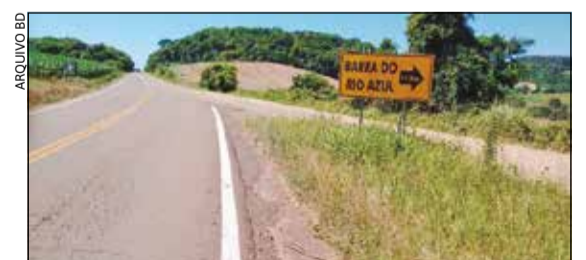
A obra irá ampliar a segurança na rodovia, pois o acesso é considerado de difícil acesso pelos motoristas

A participação popular é extremamente importante, uma vez que o Plano Diretor é o principal instrumento de organização do crescimento da cidade, definindo diretrizes para áreas como uso do solo, mobilidade urbana, habitação, infraestrutura e desenvolvimento sustentável.