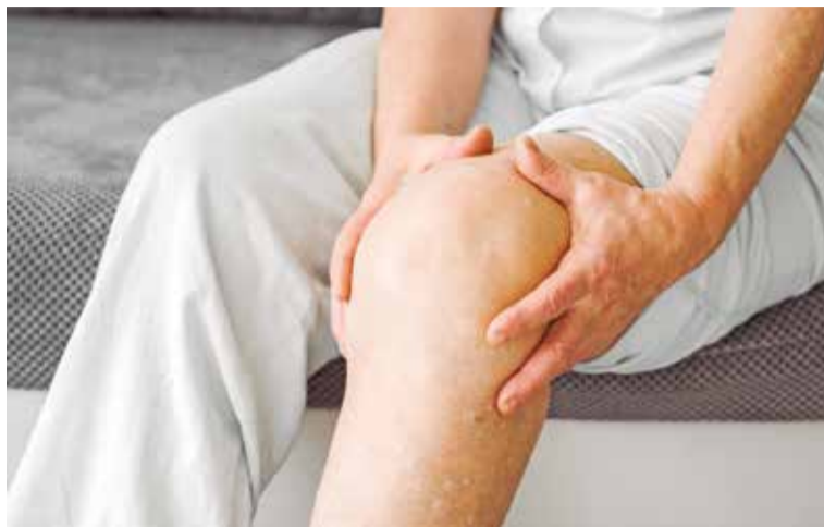
Os corticoides são usados para reduzir inflamações e dores ao serem infiltrados diretamente na área afetada

Após cerca de duas horas, quando o efeito da anestesia diminui, a dor pode retornar temporariamente. Já a ação anti-inflamatória do corticoide começa a ser percebida aproxi-