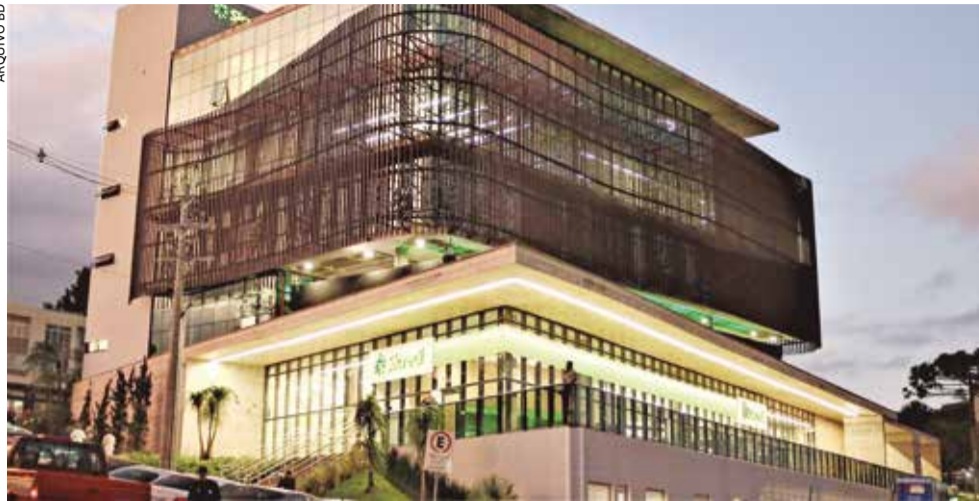
O evento será realizado no Espaço Cooperar da Sicredi UniEstados