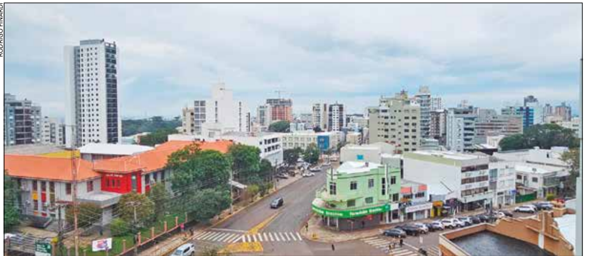
Os projetos precisam conversar entre si. Caso contrário, a conta poderá chegar duas vezes ao contribuinte