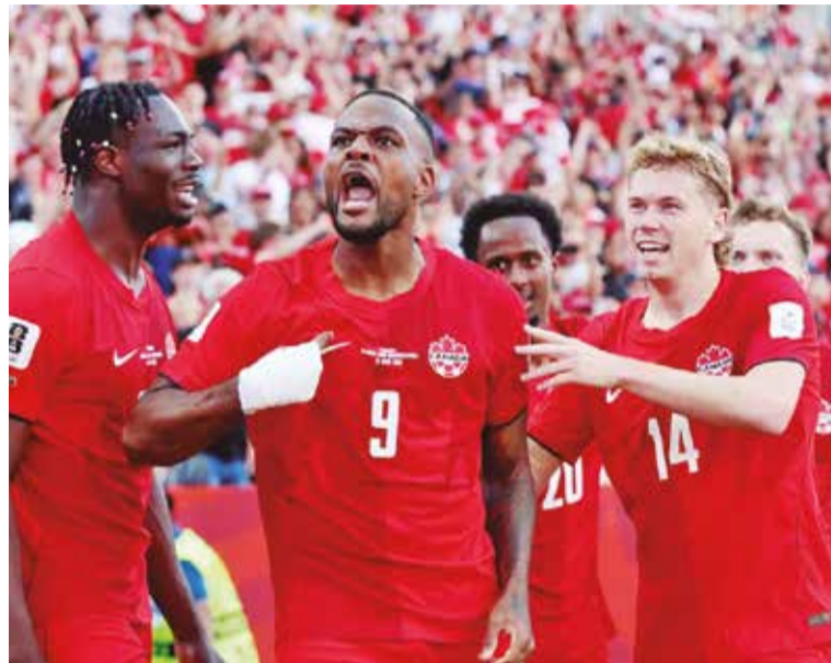
Canadá saiu atrás no placar, mas buscou o empate

A sexta-feira ainda foi marcada pela abertura do Mundial nos Estados Unidos e partida entre os donos da casa contra o Paraguai, pelo Grupo D, mas o jogo ocorreu após o fechamento desta edição.