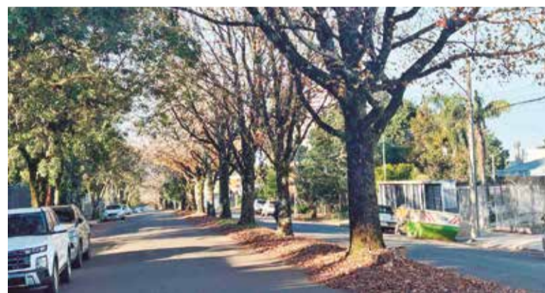
Evento reúne expositores, atrações culturais e gastronomia

Mais informações podem ser acompanhadas pelo Instagram do evento: @festivaloutonoerechim.