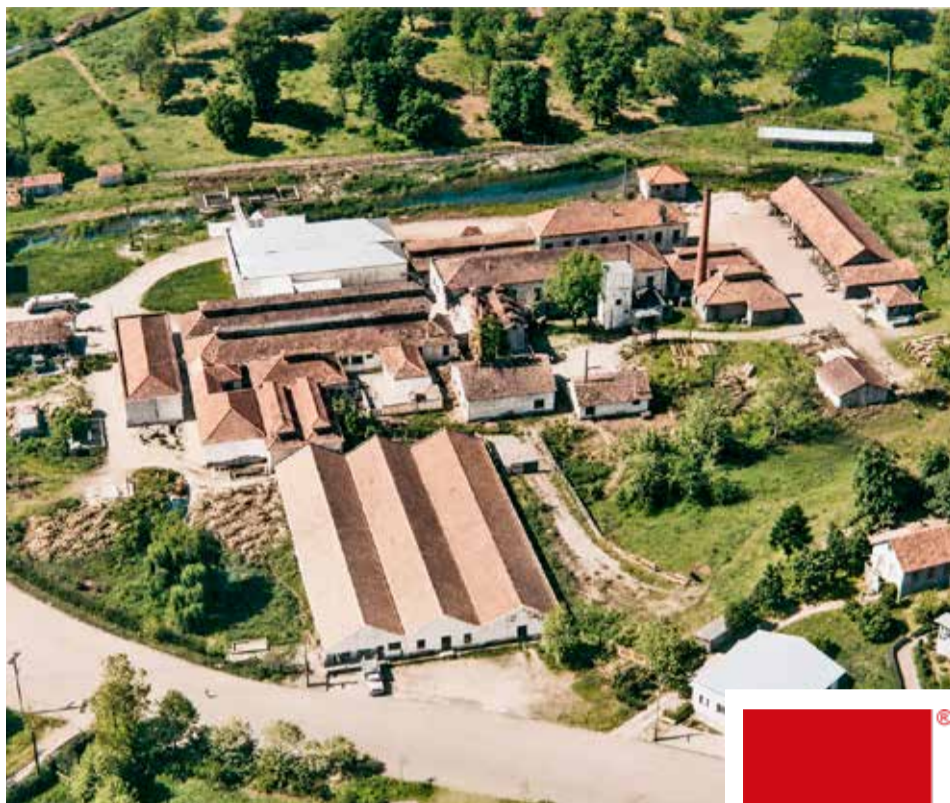
Frigorífico Boavistense, em Erechim, no registro feito no ano de 1972.