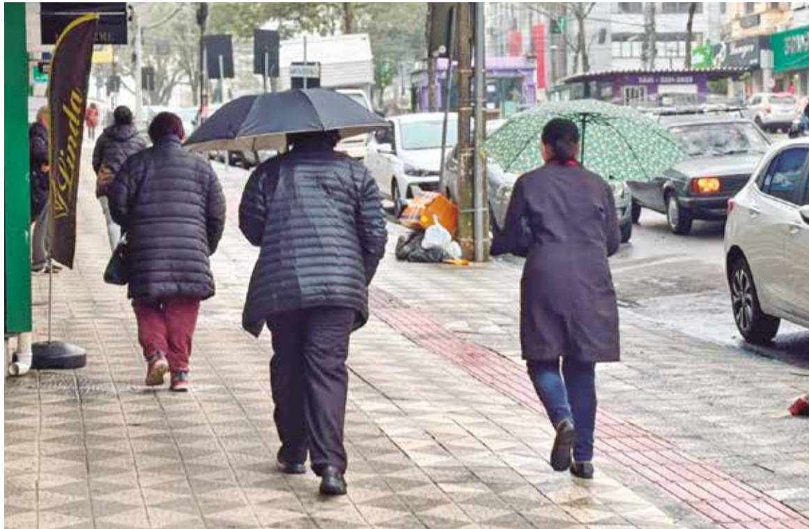
Massa de ar polar derruba temperaturas e aumenta risco de geada no Alto Uruguai

Para o sábado (13), a previsão é de tempo firme na maior parte do Estado. Conforme o boletim da Defesa Civil do Rio Grande do Sul, apenas algumas