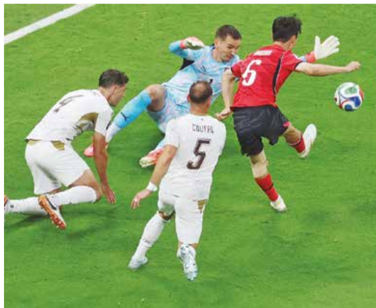
Seleções fizeram um jogo de confronto físico intenso

A primeira rodada do Grupo A da Copa do Mundo foi fechada na noite de quinta-feira, com vitória de virada a Coreia do Sul sobre a Tchêquia por 2 a 1, em Guadalajara, no confronto que marcou o retorno dos tchecos ao torneio após 20 anos de ausência.