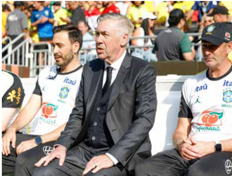
Seleção Brasileira de Ancelotti tem alguns titulares absolutos, mas em algumas posições, técnico mantém mistério

O Brasil foi golpeado com a lesão de Wesley no primeiro tempo do amistoso contra o Egito. O curioso é que Danilo, que chegou ao Flamengo em janeiro de 2025, praticamente não atuou na lateral-direita desde que se transferiu ao Rubro-negro. Está jogando como zagueiro, assim como fez em seus últimos anos de Juventus, da Itália. Sobre a posição, Ancelotti se limitou a dizer que "é uma pena a lesão de Wesley, agora, temos jogadores que podem o substituir."