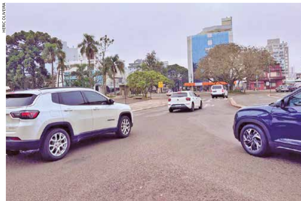
Projeto busca desafogar o movimento na região central da cidade