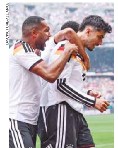
Tetracampeã, Alemanha estreia neste domingo diante de Curaçao

Já o domingo promete estreias de peso. Em Vancouver, no Canadá, jogam Austrália e Turquia, encerrando a primeira rodada do Grupo D; em Houston, EUA, a Alemanha enfrenta Curaçao, pelo Grupo E; a Holanda faz sua primeira partida, contra o Japão, em Arlington, EUA; Costa do Marfim e Equador jogam na Filadélfia, pelo Grupo E, e fechando o dia, Suécia e Tunísia jogam em Guadalupe, no México.