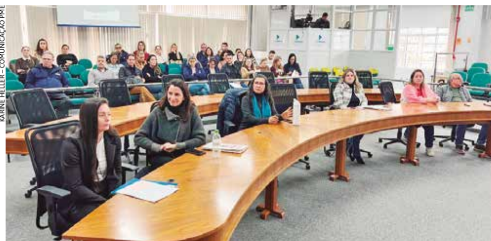
O encontro teve objetivo qualificar os processos de trabalho e a assistência prestada