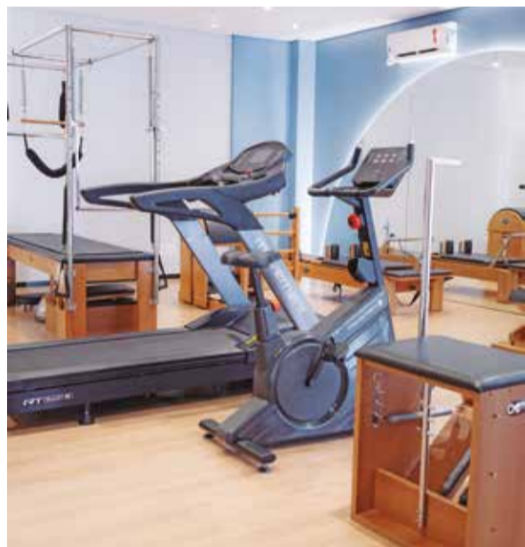
O espaço da clínica oferece diversas especialidades da fisioterapia, atendendo pacientes de todas as idades com abordagens específicas para cada fase da vida

é a base da fisioterapia. É por meio do movimento que ocorre a transformação, mas isso exige um olhar humano”, completa Tânia .