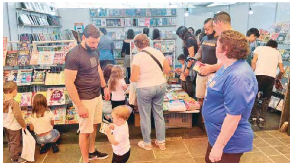
ARQUIVO COMUNICAÇÃO PME

As inscrições podem ser feitas até o dia 16 de abril de 2026, de forma presencial ou por e-mail, conforme orientações disponíveis no edital. A documentação