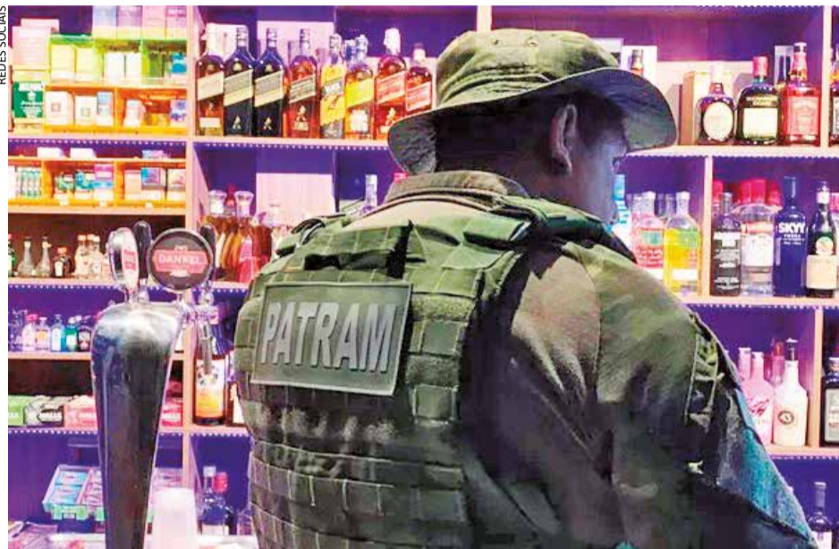
Em quatro municípios, 11 estabelecimentos foram fiscalizados

Ação da Brigada Militar, em parceria com outros órgãos, aconteceu em Erechim, Passo Fundo, Carazinho e Frederico Westphalen