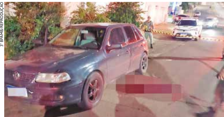
Vítima foi encontrada caída ao lado de veículo estacionado

O homem ferido foi encaminhado para atendimento hospitalar, chegou a ser encaminhado para o bloco cirúrgico, mas não resistiu aos ferimentos.