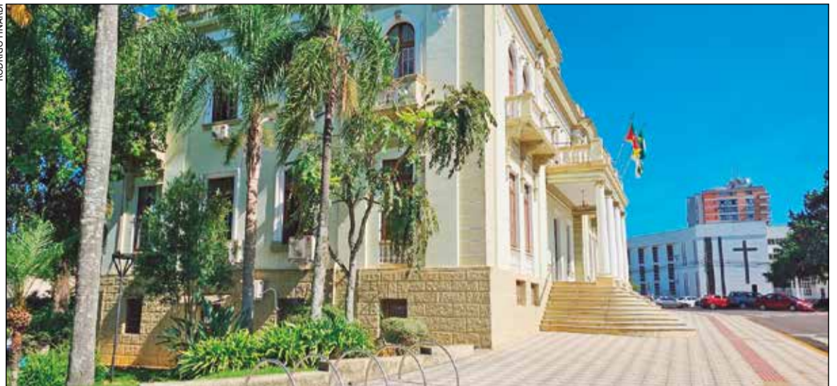
Projeto do Executivo que será apreciado hoje na Câmara de Vereadores e a readequação da legislação traz muitas mudanças

O projeto prevê ainda mudanças no Imposto sobre Transmissão de Bens Imóveis (ITBI), incluindo novas regras para definição da base de cálculo em casos como usufruto, arrematação judicial e transmissão de propriedade. Também amplia o prazo de validade das avaliações imobiliárias de três para seis meses, facilitando processos de compra e venda.