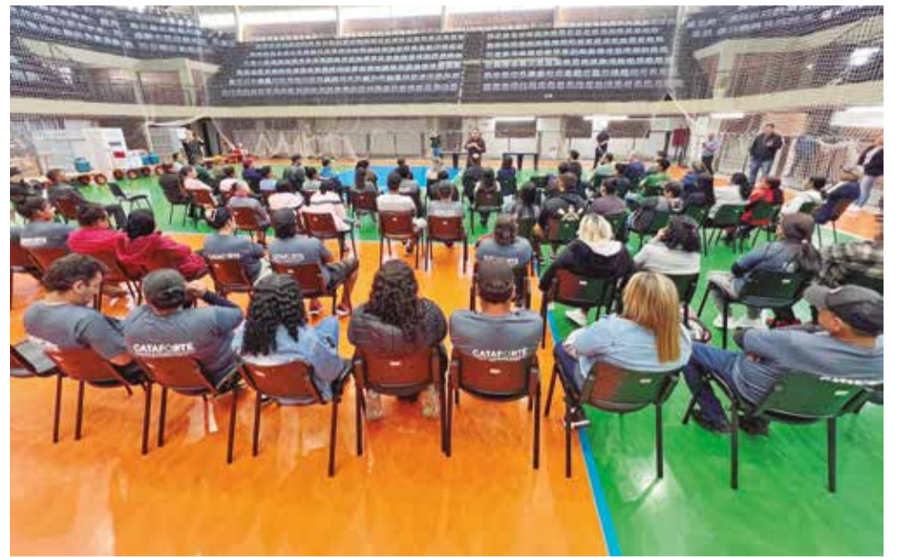
Evento ocorreu na sexta-feira (10), no Ginásio Municipal Renan Carlos Agnolin

O prêmio deverá ser retirado na Secretaria Municipal da Fazenda, localizada na Avenida XV de Novembro, 175, no prazo de até 90 dias a partir da data do sorteio.