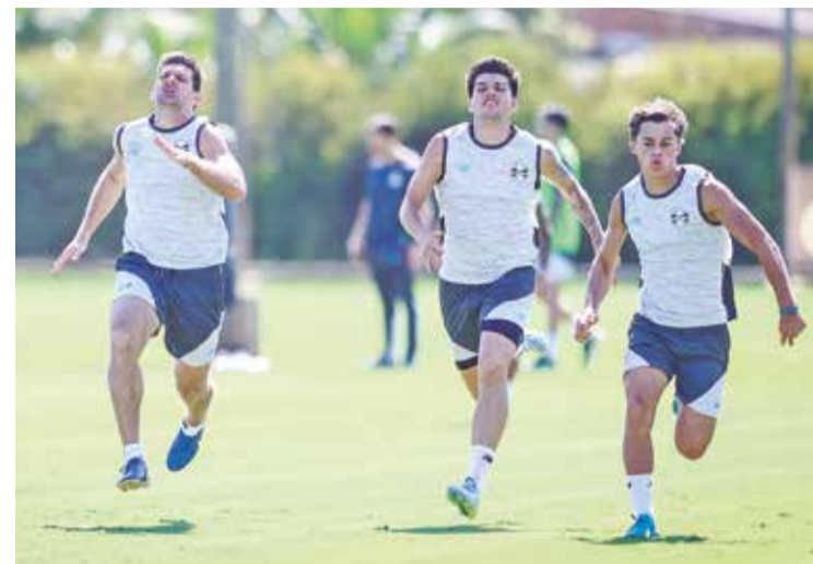
Tricolor busca recuperação na competição continental

ALAN DELFIN DIAS | jornalismo@jornalbomdia.com.br