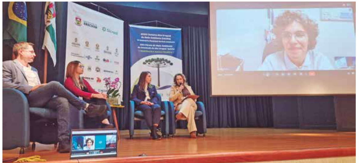
Participantes defenderam ações coletivas na prevenção de acidentes climáticos

relatou a experiência do município após as enchentes de 2023 e 2024 que causaram danos à infraestrutura pública, incluindo a perda de veículos, prejuízos em unidades