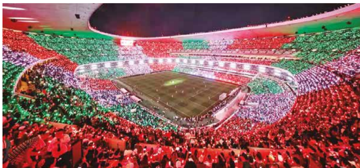
Shows e primeiro jogo ocorrem no histórico Estádio Azteca, que vai receber sua terceira Copa

Em seguida, às 23h, os holofotes se voltarão para Guadalajara, onde Ásia e Europa