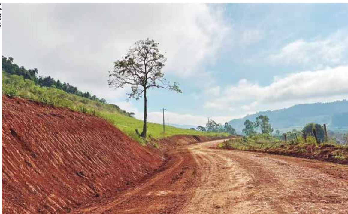
Previsão é de que novos segmentos da rodovia passem pelas etapas de preparação nos próximos meses