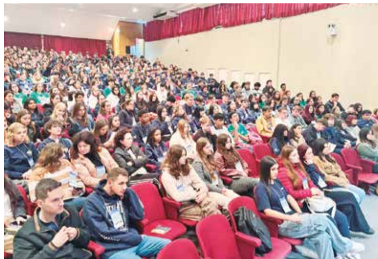
Estudantes discutiram os impactos das mudanças climáticas e elaboraram propostas para mitigar riscos ambientais

De acordo com a organização, as propostas construídas pelos grupos serão apresentadas posteriormente em seminários virtuais, ampliando o debate sobre estratégias de adaptação e mitigação das mudanças climáticas na região do Alto Uruguai.