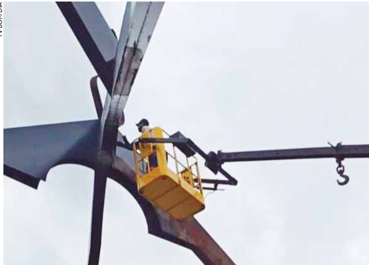
Trabalhos junto ao pórtico iniciaram nesta semana

Inaugurado em dezembro de 2008, o pórtico foi concebido para representar a diversidade