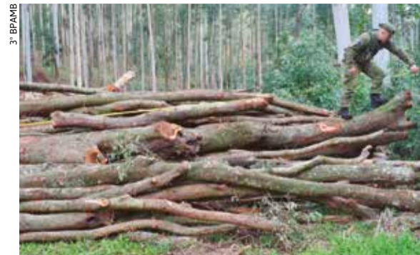
Policiais apreenderam cerca de 30 m³ de madeira nativa em toras

Equipe do 3º Batalhão de Polícia Ambiental (BPAMB) da Brigada Militar encontrou na segunda-feira (8), um estoque de madeira nativa destinada à produção de carvão vegetal, no município de Aratiba.