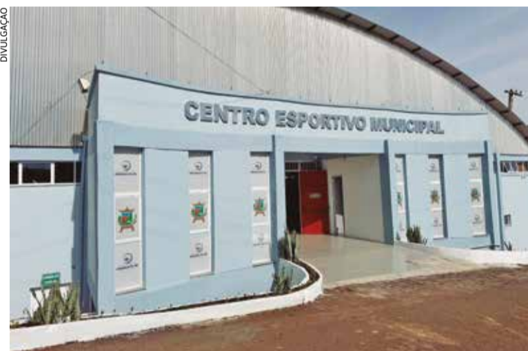
Comunidade local e regional está convidada para acompanhar o jogo

O governo municipal convida a comunidade local e regional para acompanhar a programação esportiva e participar da atividade promovida no município.