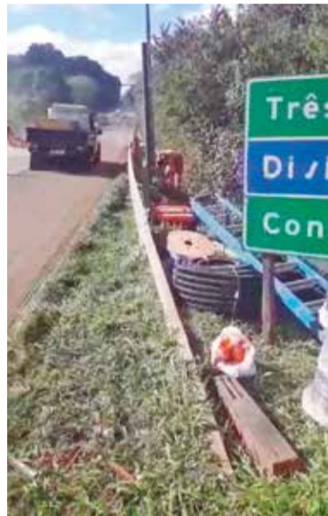
Comissão formada por representantes de bairros realizaram movimento pedindo a reinstalação do equipamento

Ainda não há uma data definida para o equipamento voltar a funcionar e, conforme informações apuradas pela reportagem, o limite de velocidade permitido no trecho deve ser de 60 km/h, mas ainda está sendo avaliada a redução para 50 km/h.