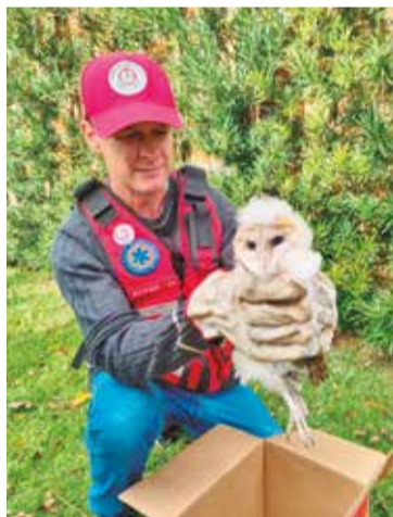
Filhote estava desorientado e sem conseguir voar

Os Bombeiros Voluntários de São Valentim e Benjamin Constant do Sul foram acionados no início da tarde de terça-feira (9), para realizar o resgate de um filhote de coruja encontrado na área urbana de São Valentim.