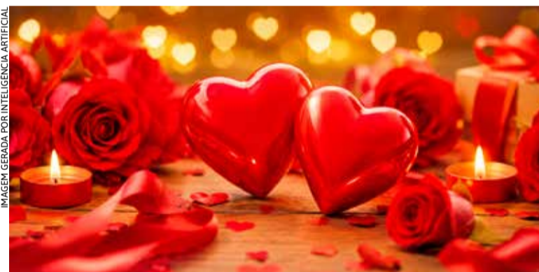
Consumidores ainda têm dois dias para comprar os presentes e aproveitar a campanha da CDL Erechim, que vai sortear 60 jantares

Para participar, basta procurar os estabelecimentos identificados com o adesivo ou cartaz oficial da campanha. Os vencedores poderão aproveitar um jantar para casal em um dos restaurantes par-