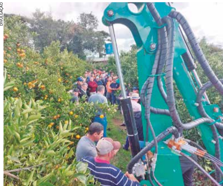
Atividade tratou de temas ligados ao mercado, conservação do solo, nutrição vegetal e uso de bioinsumos

na produção. “Com essa produtividade, colho laranja até a noite, porque tenho lucro”, comentou.